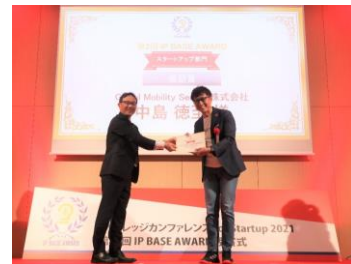
特許庁 第2回 IP BASE AWARD 奨励賞 受賞