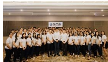
フィリピン現地法人