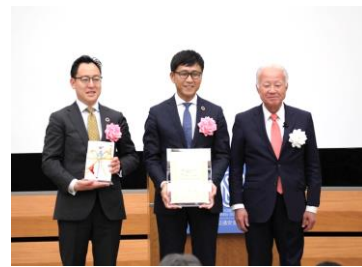
国際交通安全学会 主催 第40回国際交通安全学会 学会賞 受賞