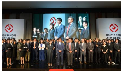
グッドデザイン金賞 経済産業大臣賞 受賞