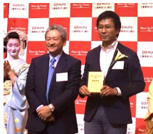
三菱東京UFJ銀行 主催 Rise Up Festa 2017 最優秀賞 受賞