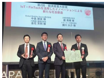
内閣府 第2回 日本オープン イノベーション大賞 経済産業大臣賞 受賞