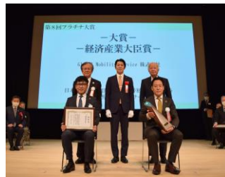
第8回プラチナ大賞 経済産業大臣賞 受賞