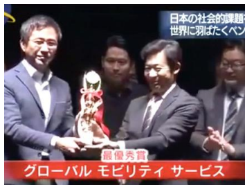
トーマツ・野村証券 主催 Morning Pitch Special Edition 2016 最優秀賞 受賞