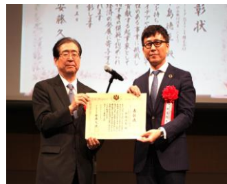
中小機構基盤整備機構 主催 JAPAN VENTURE AWARDS 2019 中小企業庁長官賞 受賞