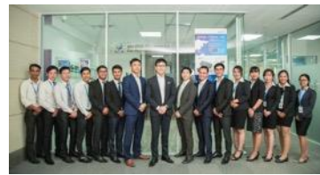
カンボジア現地法人