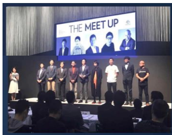
日本自動車工業会 主催 東京モーターショー 2017 優勝