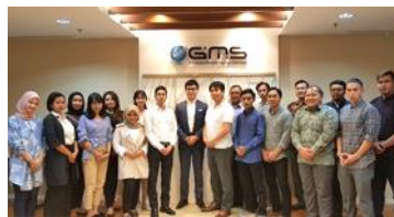
インドネシア現地法人